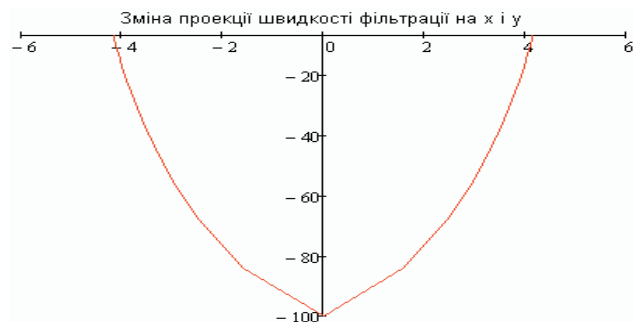
Рис. 1. Розподілення води у ґрунтовому шарі при моделюванні

Результат розрахунку швидкості фільтрації представлений на рис. 1.