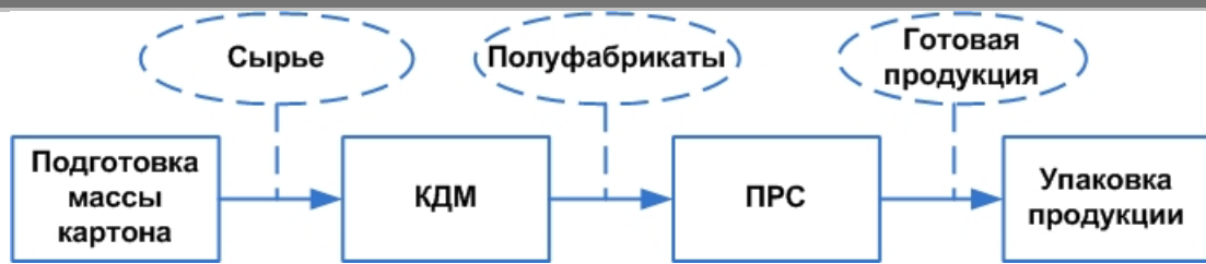
Рис. 2. Схема производства картона.

Взаимодействие технологического процесса с подсистемами АСУП описано выше.